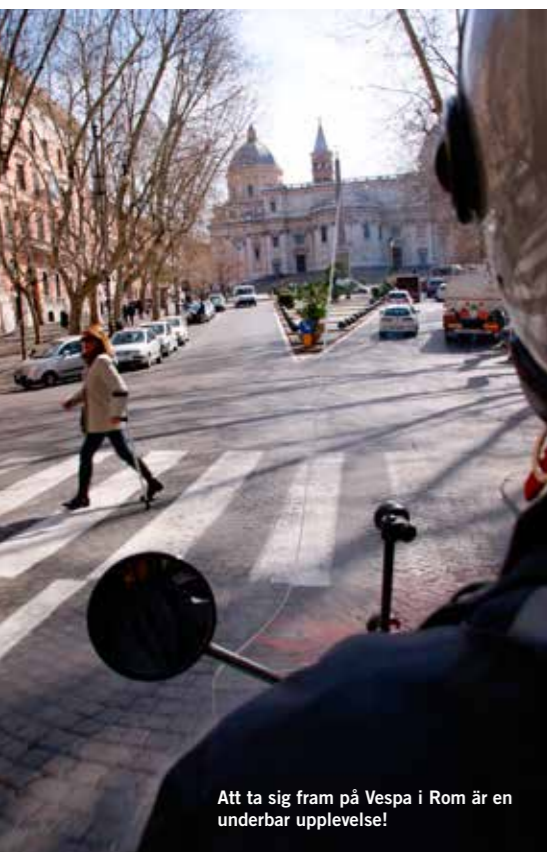
Att ta sig fram på Vespa i Rom är en underbar upplevelse!