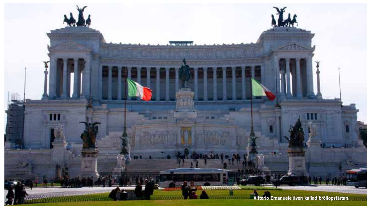
Vittorio Emanuele även kallad bröllopstårtan.